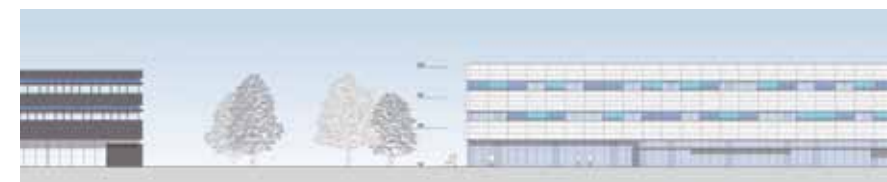
Eine weitere Ansicht des Neubaus der HNU.