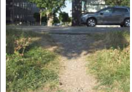
Der Trampelpfad verführt zum Überqueren der Straße.

Auch in diesem Jahr fand im Anschluss an die jährliche Putzete wieder die Ostereiersuche statt, welche schon eine feste Größe im Terminkalender unseres Stadtteils ist. Dank der vielen Sponsoren wie Rewe, Metzgerei Stötter, Wiley-Apotheke u. v. a. konnte die Ostereiersuche auch dieses Jahr wieder erfolgreich durchgeführt werden. Vielen Dank für das Engagement in Wiley-Süd. Wie auch im vergangenen Jahr kamen über 200 Anwohner mit ihren Kindern – Tendenz steigend – die sich auch gleich sehr engagiert auf die Suche machten. Immer wieder erstaunlich, dass kein noch so schwieriges Versteck vor den Kindern sicher ist. Alles wird gefunden. Die nächste Ostereiersuche, hat nach derzeitigem Stand, wieder einen festen Platz im Terminkalender 2016. Vielen herzlichen Dank auch an alle Helfer die zum guten Gelingen der Veranstaltung beigetragen haben. (eh)