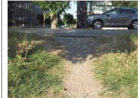
Der Trampelpfad verführt zum Überqueren der Straße.

Auch in diesem Jahr fand im Anschluss an die jährliche Putzete wieder die Ostereiersuche statt, welche schon eine feste Größe im Terminkalender unseres Stadtteils ist. Dank der vielen Sponsoren wie Rewe, Metzgerei Stötter, Wiley-Apotheke u. v. a. konnte die Ostereiersuche auch dieses Jahr wieder erfolgreich durchgeführt werden. Vielen Dank für das Engagement in Wiley-Süd. Wie auch im vergangenen Jahr kamen über 200 Anwohner mit ihren Kindern – Tendenz steigend – die sich auch gleich sehr engagiert auf die Suche machten. Immer wieder erstaunlich, dass kein noch so schwieriges Versteck vor den Kindern sicher ist. Alles wird gefunden. Die nächste Ostereiersuche, hat nach derzeitigem Stand, wieder einen festen Platz im Terminkalender 2016. Vielen herzlichen Dank auch an alle Helfer die zum guten Gelingen der Veranstaltung beigetragen haben. (eh)