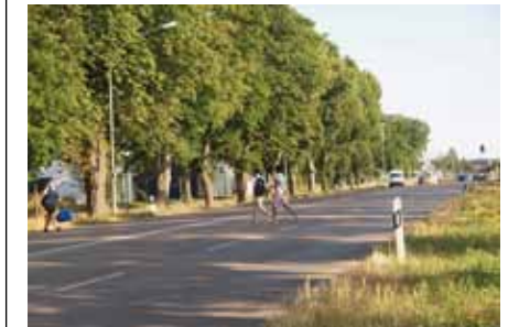
Gefährlich: Viele Anwohner überqueren die Memminger Straße nicht an den Ampelanlagen.

Private Musikschule bei Ihnen zu Hause Tel. 0176 - 23763643 www.musikschule-notabene.de