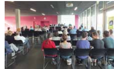
Reges Interesse der Bürger herrschte beim Bürgergespräch in der HNU.

Da ist besonders der Bau einer neuen Grundschule im Wiley-Nord zu nennen. Die Mark-Twain-Schule wird 16 Klassen stark sein und auch eine Mittags- und Ganztagesbetreuung anbieten. Baubeginn ca. 2018, Einweihung 2019. Auch Kitas und Krippenplätze werden benötigt.