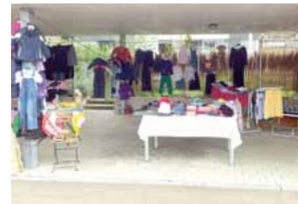
Reichlich Angebote beim Hofflohmart im Wiley.

Wir sorgen für die Pressearbeit und veröffentlichten auf der Internetseite bv-wiley.de ihre Teilnehmeradresse. Näheres für Mitglieder auch über den Newsletter des Bürgervereins.