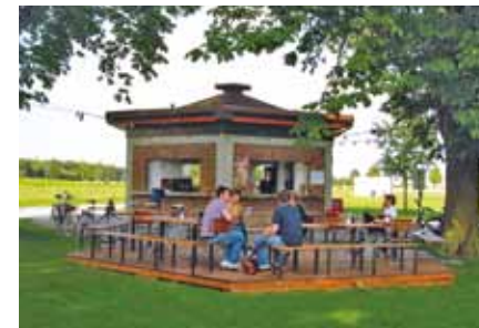
Gemütlich sitzen und den Wileypark genießen.

Gemütlich inmitten von Kastanienbäumen liegend, lädt der Kiosk auf ein kühles Bier und einen kleinen Imbiss ein. Diverse leckere Kuchen, kleine Snacks, Eis und ein ansprechendes Angebot an alkoholischen und nichtalkoholischen Getränken bieten sich zu einem kleinen Ausflug an. Die bereitgestellten Liegestühle verbreiten einen Hauch von Urlaubsfeeling. Genau das richtige für den heißen Sommer.